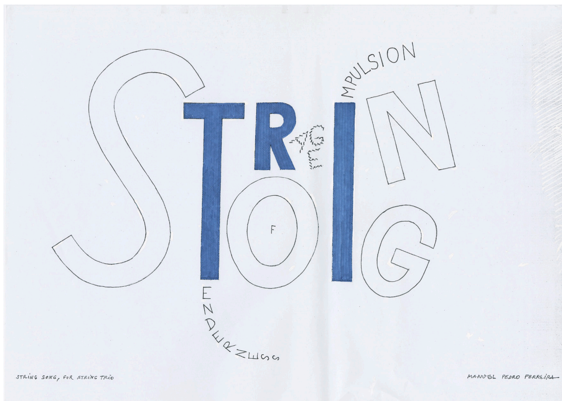
Exemplo 5. Folha de capa de String Song , para trio de cordas

tonalidades (Ex. 5). 47 Finalmente, em Seis irmãos , para piano solo (2021), a série desdobra-se, ao longo da composição, em seis escalas heptatônicas, correspondentes aos diferentes andamentos (sendo, portanto, à superfície, completamente inaudível). 48 Em suma, o uso de sonoridades e de proporções medievais é posto ao mesmo nível dos métodos seriais: ocupam quase sempre o plano de fundo, emergindo só ocasionalmente em primeiro plano.